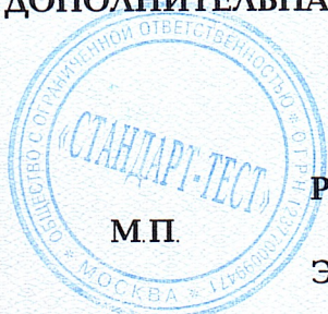
Схема сертификации: 1с.